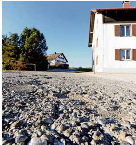
Eine umfangreiche Sanierung der Sulzberger Straße beim Ortsteil Hammerschmiede steht demnächst in Durach an.

Im März dieses Jahres hat der Sender „SWR“ Wintermotive einer historischen Schlittenfahrt mit Holzarbeiten für Brennholz in Wertach aufgenommen. Diese Aufzeichnung wird am ersten Advent, am kommenden Sonntag, 27. November, unter dem Titel „Land“ im SWR ausgestrahlt. Der Beitrag wird ab 15 Uhr gesendet. (az)